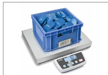
Composizione di miscele